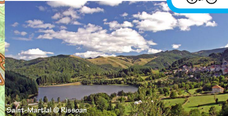
Saint-Martial © Rissoan