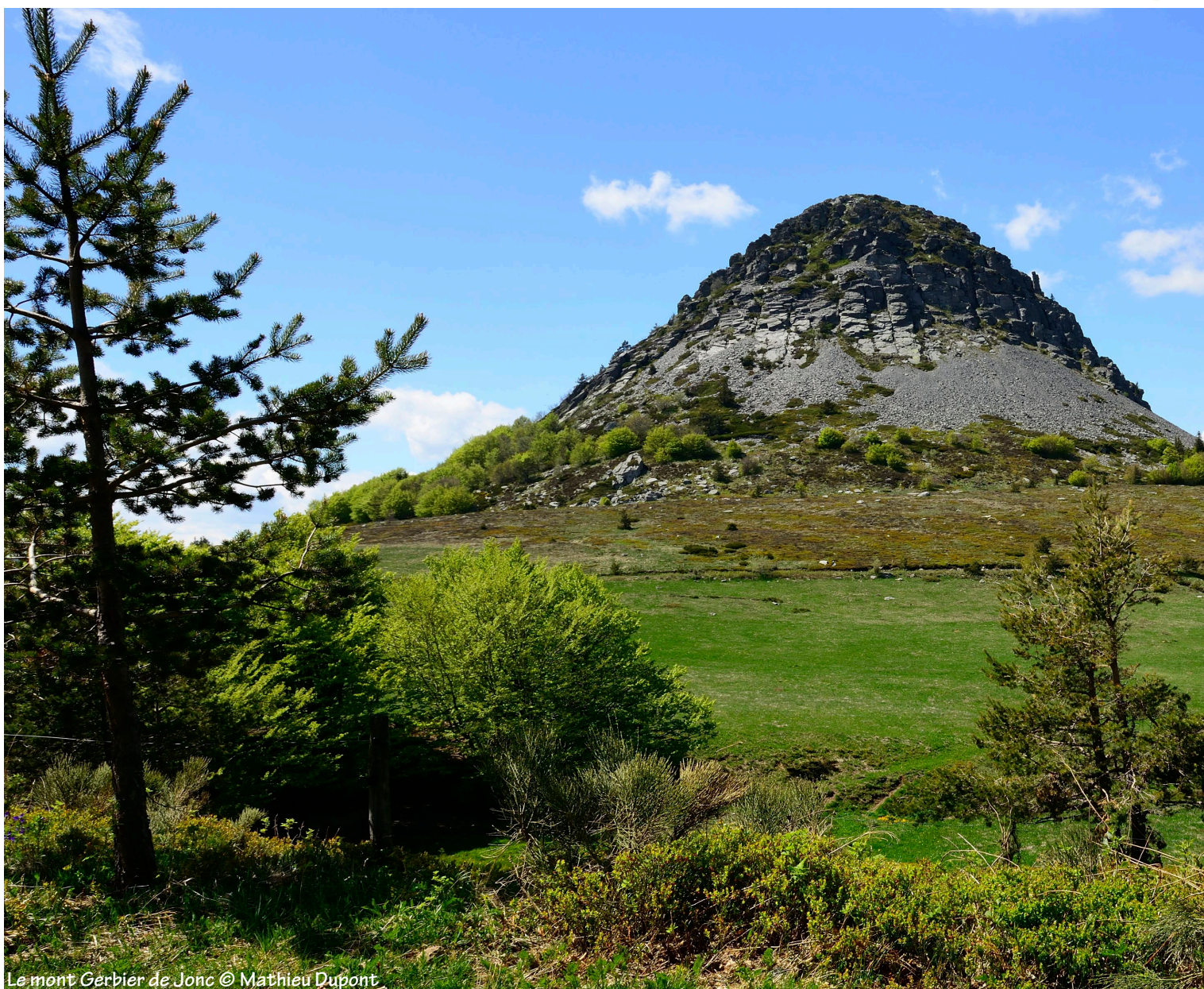
Le mont Gerbier de Jonc