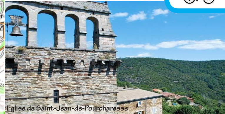
Eglise de Saint-Jean-de-Pourcharesse