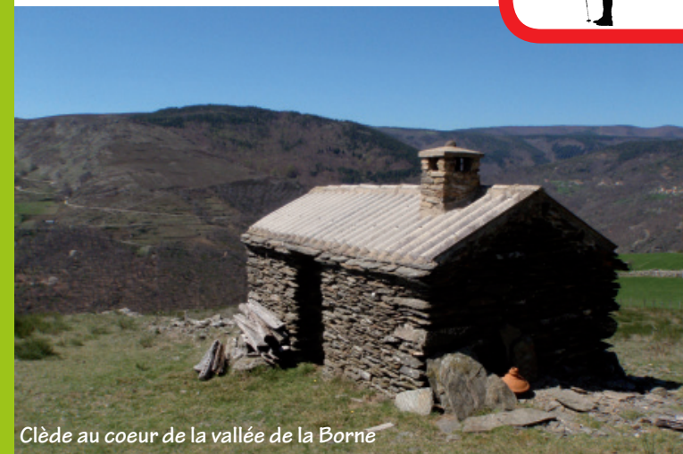
Clède au coeur de la vallée de la Borne