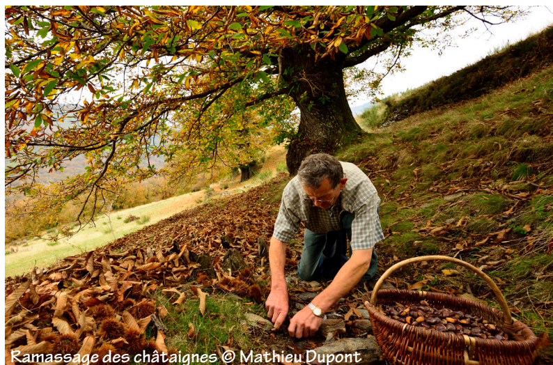
Ramassage des châtaignes

Remonter par le même chemin, passer la croupe acérée, traverser la châtaigneraie et retrouver la fontaine du haut et le GRP. Plus que 500m avant l'arrivée au village.