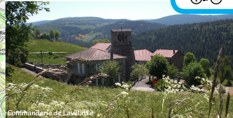
Commanerie de Lavillatte