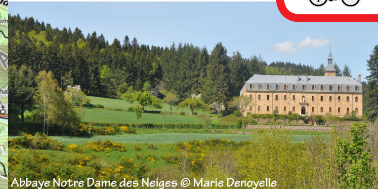
Abbaye Notre Dame des Neiges © Marie Denoyelle