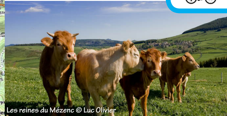
Les reines du Mézenc