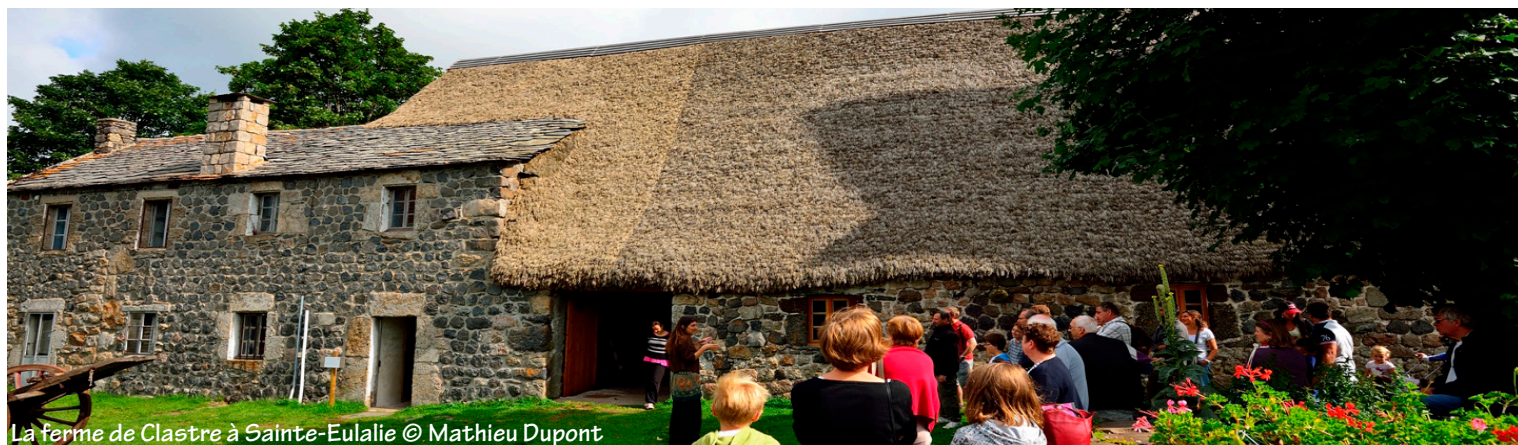
La ferme de Clastre à Sainte-Eulalie